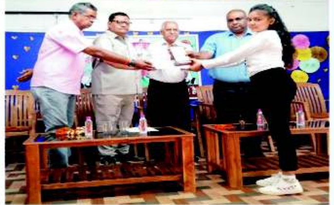
‘प्रतिभा सम्मान समारोह’ 21-03-2022