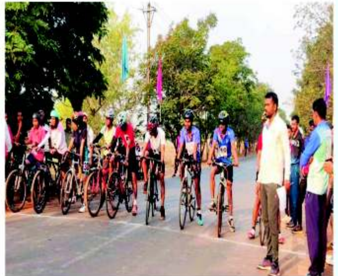
‘इंटर कॉलेज(म./पु.) रोड सायकिलिंग रेस स्पर्धा’ 02-04-2022