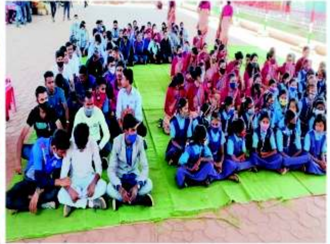
‘एक दिवसीय समाजिक जनचेतना एवं निःशुल्क स्वास्थ्य परीक्षण शिविर ग्राम-हसदा नं. - 02’ 23-02-2022