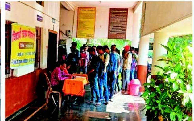
'विद्यार्थी स्वास्थ्य परीक्षण शिविर' 29-11-2021