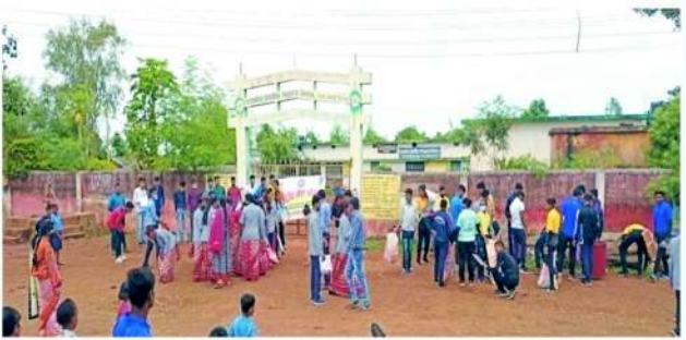
'स्वच्छता ही सेवा' 02-10-2021