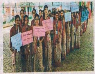
दवाइयों का किया गया वितरण

नेताजी सुभाष महाविद्यालय, बेलभाठा, अभनपुर, शिक्षा संकाय एवं एनएसएस इकाई के संयुक्त तत्वावधान में एक दिवसीय सामुदायिक स्वास्थ्य परीक्षण एवं सामाजिक जन चेतना शिविर का आयोजन 23 फरवरी को ग्राम-पंचायत- हसरा में 2, बाजार चौक सह अभनपुर में आयोजित किया गया। शिविर का उद्देश्य ग्रामवासियों को सामुदायिक स्वास्थ्य एवं शिक्षा विकास को उन्नति हेतु जन-चेतना एवं स्वास्थ्य परीक्षण कार्यक्रम के माध्यम से प्रेरित करना था। इस एक दिवसीय सामुदायिक स्वास्थ्य परीक्षण एवं सामाजिक जन चेतना शिविर में बीएड, छात्र/छात्राओं एवं एनएसएस इकाई द्वारा प्रामुख्य कर स्वास्थ्य एवं सामाजिक जन-चेतना संशोधन का प्रचार प्रसार किया साथ ही ग्राम के विभिन्न स्थानों पर स्वास्थ्य उन्नयन संबंधी नुस्खे नोट, नारा मुक्ति