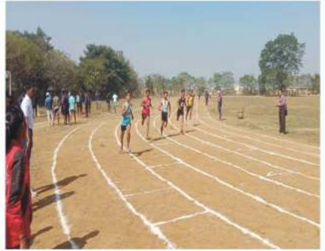
‘रायपुर परिक्षेत्र स्तरीय अंतर महाविद्यालयीन एथलेटिक्स(म./पु.) प्रतियोगिता’ 20 एवं 21 दिसम्बर 2021