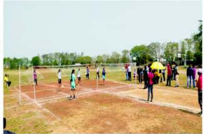
‘अंतरमहाविद्यालयीन बालबैडमिंटन(म./पु.) प्रतियोगिता’ 19-02-2022