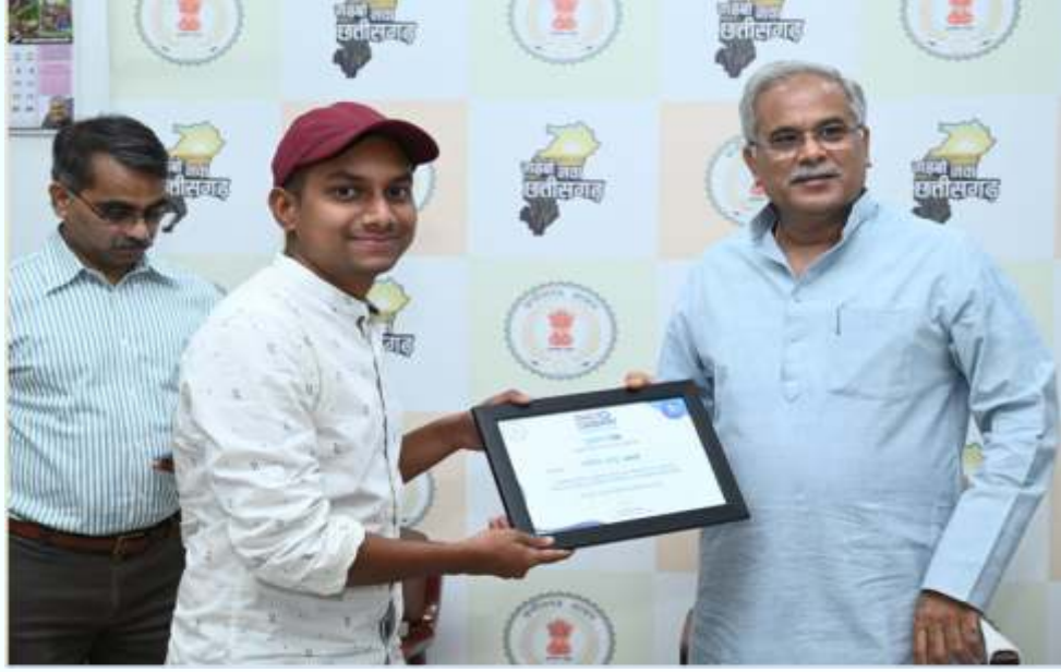
माननीय मुख्यमंत्री द्वारा सम्मानित बी.पी.एड द्वितीय सेमे. के विद्यार्थी (फोटो ग्राफी अवार्ड )