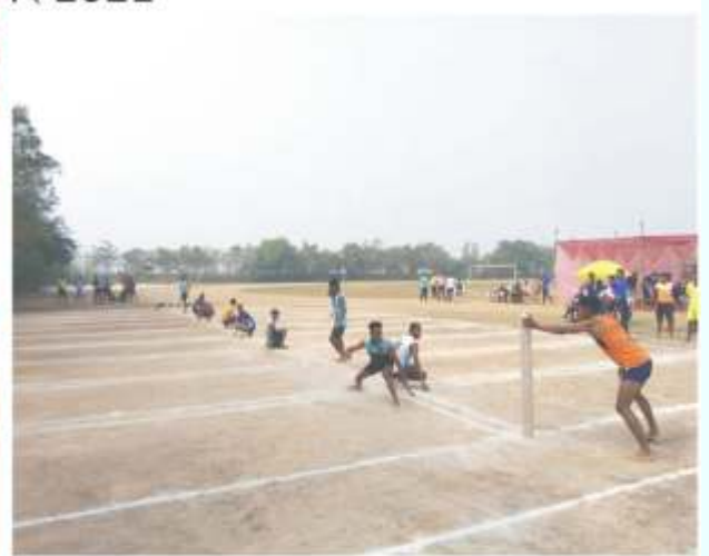
‘रायपुर परिक्षेत्र स्तरीय अंतर महाविद्यालयीन खो-खो (म./पु.) प्रतियोगिता’ 28 एवं 29 दिसम्बर 2021