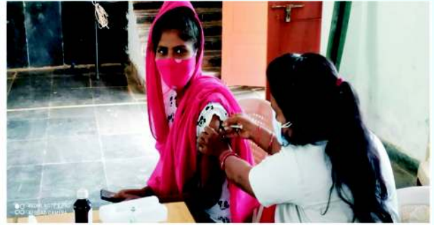
कोविड-19 टीकाकरण अभियान 28-06-2021