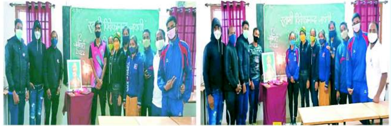
‘राष्ट्रीय युवा दिवस’ 12-01-2022