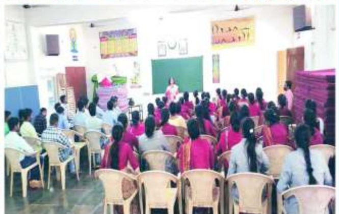
'National Workshop On Communication Skill & Psychological Assessment' 17-04-2022