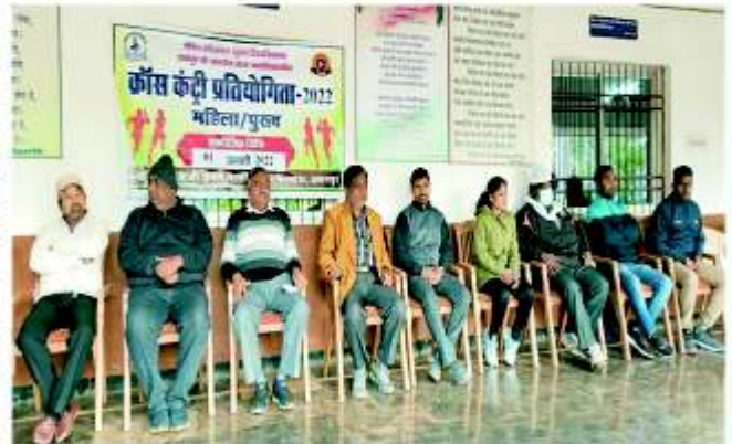
‘अंतरमहाविद्यालयीन क्रॉस कंट्री(म./पु.)’ प्रतियोगिता 01-01-2022