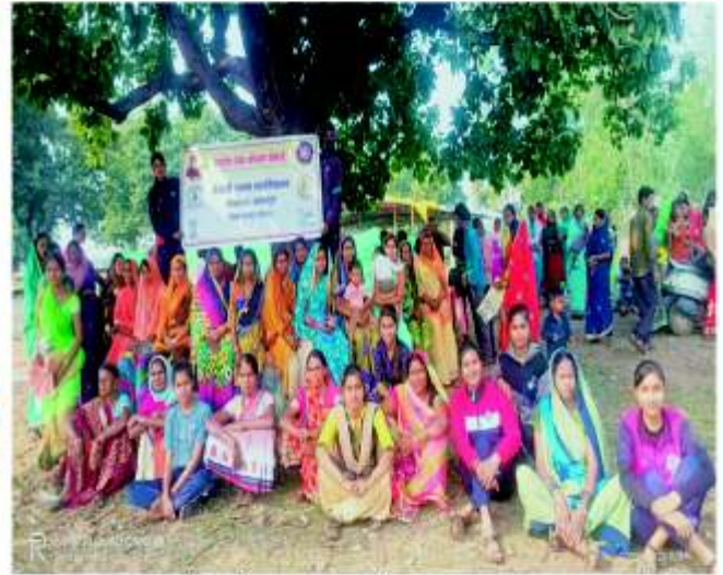
‘राष्ट्रीय सेवा योजना’ सात दिवसीय शिविर ग्राम - थनौद(अभनपुर) 24-12-2021 से 30-12-2021 rd